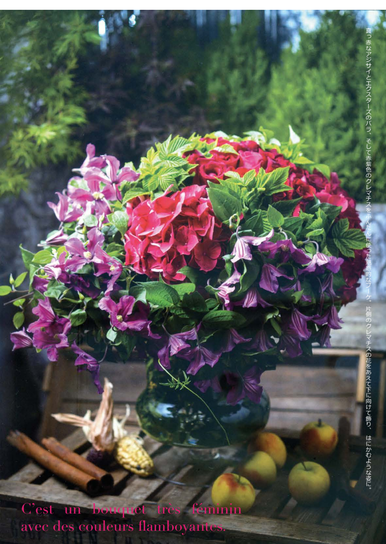
C'est un bouquet très féminin avec des couleurs flamboyantes.

Les feuilles de spirée deviennent un peu rouge comme la couleur des roses Avalanche Pearl.