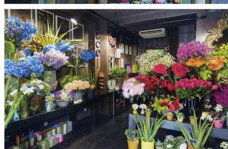
上・上/鮮やかなブルーやパールの花々が目を引く一角。上/コーナーごとに花の配色を美しくまとめて、棚に幾つちも並べたフチ・ブーケもかわいらしいと大人気。