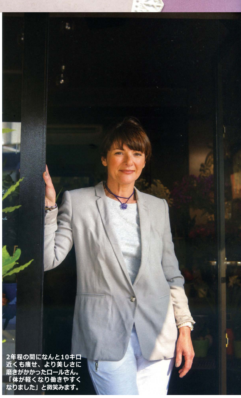
2年程の間になんと10キロ近くも痩せ、より美しさに磨きがかかったロールさん。「体が軽くなり働きやすくなりました」と微笑みます。